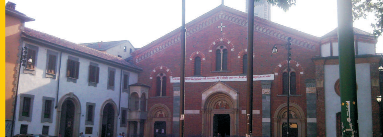
La Basilica di Sant'Eustorgio a Milano