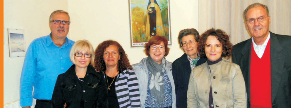
Alcuni volontari del "Centro di Aiuto alla Vita" di Ragusa

come dono di Dio, gratuito e intangibile.