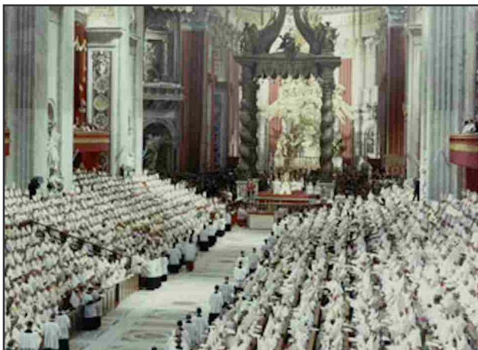
Foto del Concilio Ecumenico Vaticano II

Attraverso questo Giubileo Papa Francesco mostra all'umanità ferita una Chiesa dal volto materno che non aspetta che i