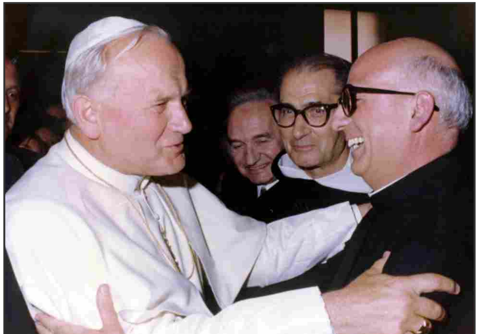
Padre Sorge con Papa Giovanni Paolo II

Qui il Concilio ha fatto dei passi notevolissimi, ha sviluppato la