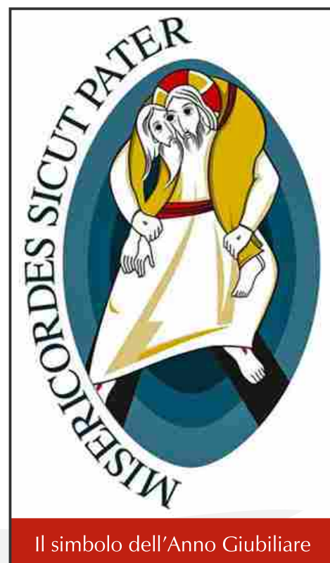
Il simbolo dell'Anno Giubilare

Inoltre l'evangelizzatore, nel mettere in pratica il metodo della cellula, deve essere mosso dallo Spirito di Misericordia che lo spinge ad attuare e mettere in pratica tutte le opere di misericordia per il bene dei fratelli. Così facendo si realizzano tutte e sette i fini della cellula.