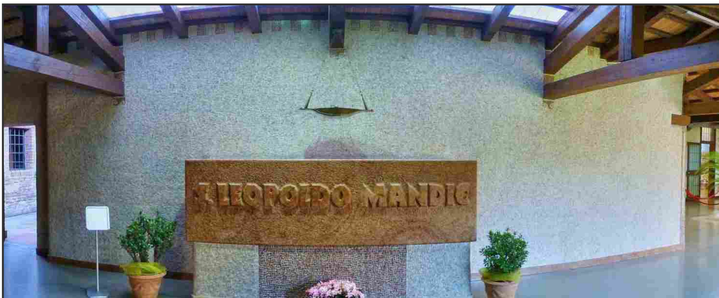
La tomba di San Leopoldo Mandic

E' difficile seguire P. Leopoldo nell'ascesa alla perfezione perché lasciò pochissimi scritti, e nascose per principio i segreti del proprio spirito.