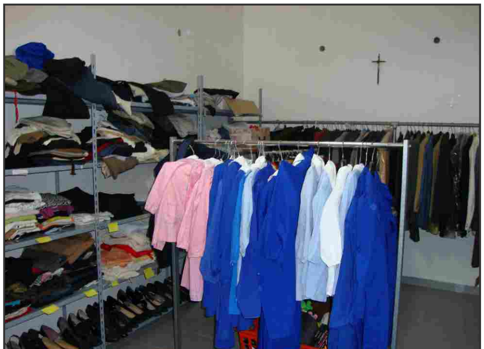
Magazzino per lo smistamento dei vestiti

alle famiglie extracomunitarie che prendevano case in affitto completamente vuote e quindi bisognose di tutto: dai letti alla cucina, dalle suppellettili ai generi di prima necessità. Nacque così il servizio di ricezione, smistamento