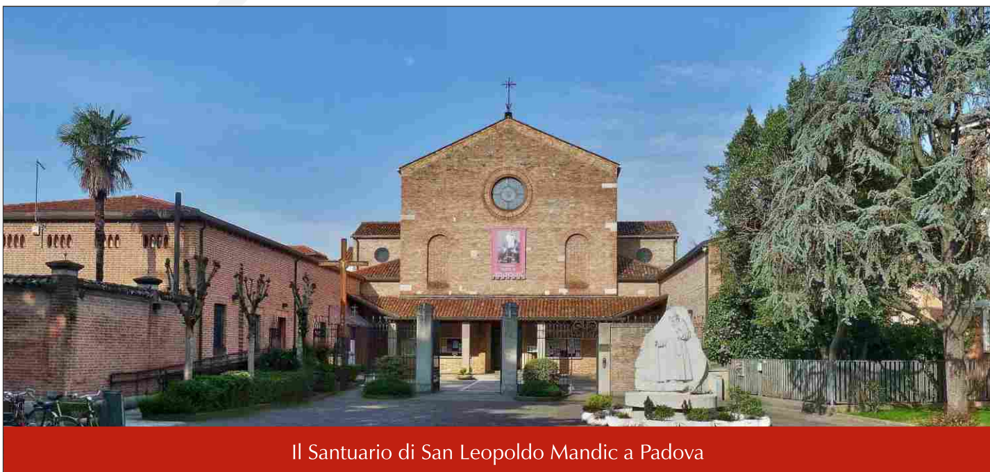
Il Santuario di San Leopoldo Mandic a Padova

Ed ha indicato come esempi due santi ministri della confessione: san Leopoldo e san Pio, che ad ogni uomo alla ricerca del perdono e della pace interiore, hanno mostrato il volto di Dio che, con tenerezza e compassione, si china su ogni suo figlio, bisognoso della sua Misericordia.