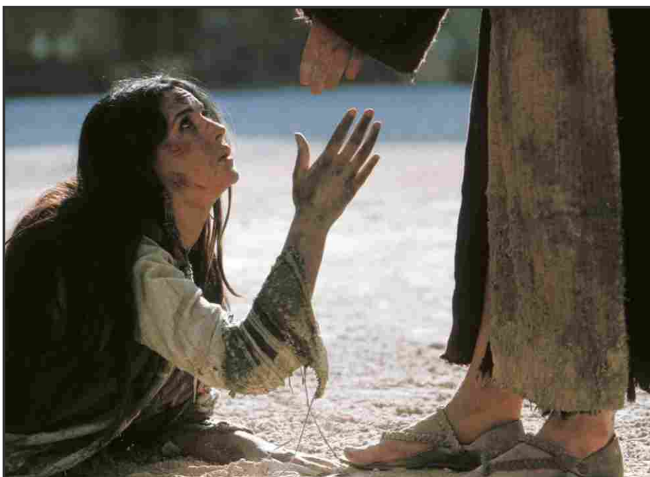
La scenda dell'adultera nel film The Passion

Sulla difficoltà a riconoscerci peccatori il Papa afferma che la guarigione può esserci soltanto se muoviamo un piccolo passo verso Dio o se abbiamo, almeno, il desiderio di muoverlo. E qui possiamo contemplare la grandezza dell'amore di Dio Padre che attende con fiducia anche soltanto un minimo pensiero di dubbio, un attimo di sconforto nel cuore che, per Lui, è già inizio di pentimento, un passaggio stretto che ci permette poi di ricevere la Sua misericordia.