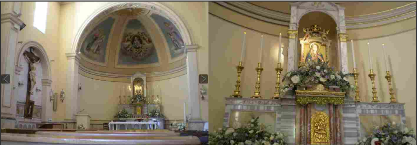
Parrocchia Madonna delle Lacrime di Trappeto Etneo

In Maria ho effettivamente trovato ispirazione e stimolo, per vivere le esigenze della sequela di Gesù.