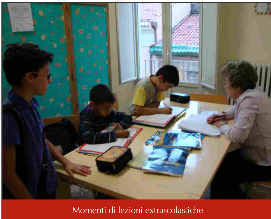
Momenti di lezioni extrascolastiche

Nel corso di questi anni, al Vo.Cri., in maniera discreta, tanti volontari si sono succeduti e prodigati offrendo con gioia il loro servizio, non per riempire il vuoto della propria vita compiendo un'azione gratificante, ma perché il volontariato cristiano appartiene all'essenza della vita cristiana, in quanto espressione e realizzazione dell'amore di Dio incarnato e vissuto nel servizio ai fratelli.