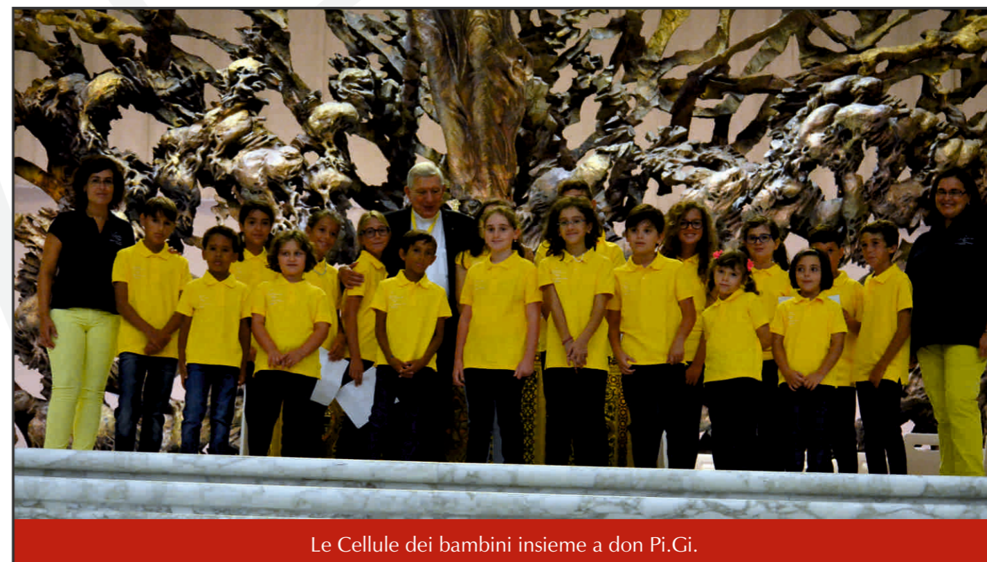
Le Cellule dei bambini insieme a don Pi.Gi.