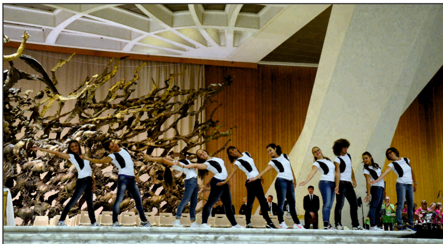
Il gruppo dei giovani di Ragusa durante un ballo