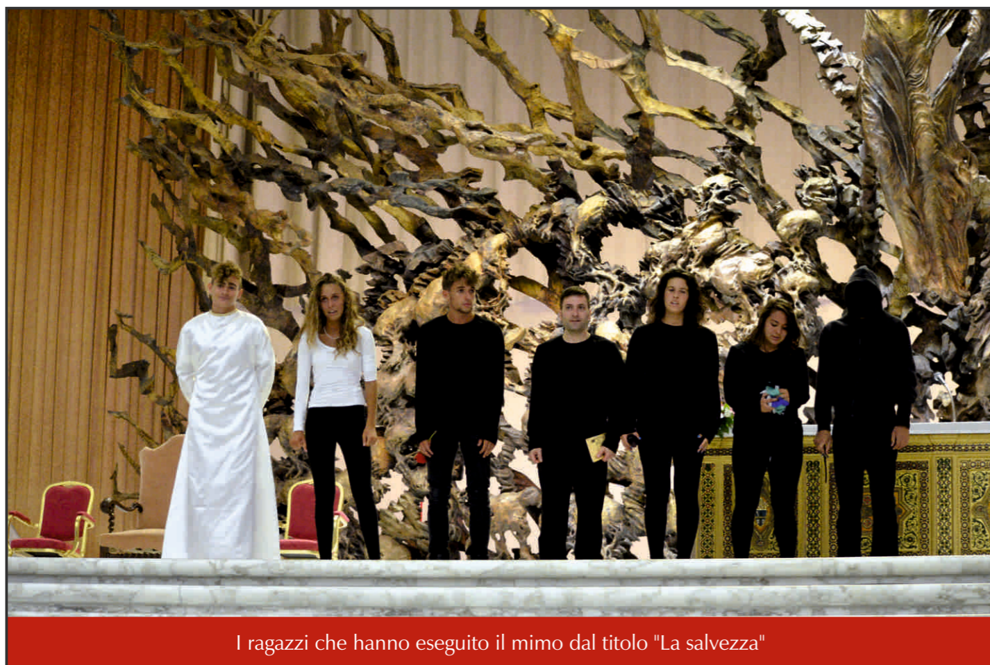
I ragazzi che hanno eseguito il mimo dal titolo "La salvezza"

comunità cristiana descritta negli Atti degli Apostoli. "Ogni giorno tutti insieme frequentavano il tempio e spezzavano il pane a casa prendendo i pasti con letizia e semplicità di cuore, lodando Dio e godendo la simpatia di tutto il popolo." (At. 2, 46-47)