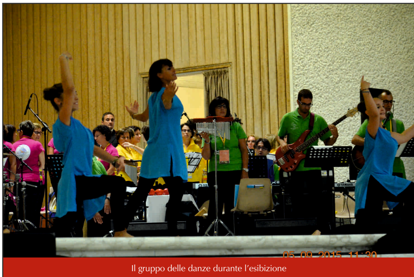
Il gruppo delle danze durante l'esibizione