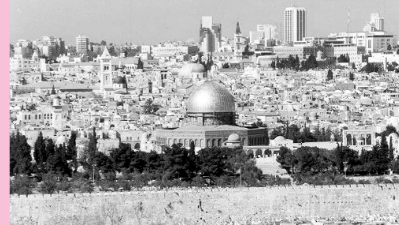
Una panoramica di Gerusalemme vista dal Monte degli Ulivi

Le testimonianze pubblicate e il rendiconto sul lavoro delle Cellule mi riportano a Gesù Risorto presente nella Eucaristia e mi fanno lodare Dio.