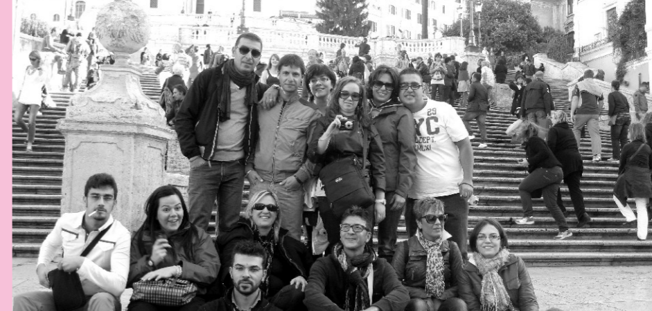
Alcuni ragazzi del Gruppo Giovani a Roma

ma che hanno permesso all'universo di evolversi fino a sostenere la vita, fino alla coscienza e alla libertà dell'uomo che vi dimora. Le leggi della fisica, lo spazio e ogni istante di tempo, che accoglie l'esistenza delle creature, è creato. Ed è commovente pensare che il mistero eterno che trae dal nulla l'universo in questo istante, si è preso cura di ciascuno di noi, come dice il salmista: « Se guardo il tuo cielo, opera delle tue dita, la luna e le stelle che Tu hai fissate, che cos'è l'uomo perché te ne ricordi, il figlio dell'uomo perché te ne curi? » (Sal 8, 4-5). Riprendendo le parole di Benedetto XVI, Bersanelli conclude: "Qualsiasi analisi matematica è muta e non riesce a dire nulla di fronte al dolore o alla gioia di una persona, e la scienza non può dare risposta a questo. Per noi Dio non è un'ipotesi distante, non è uno sconosciuto che si è ritirato dopo il big bang; Dio si è mostrato in Gesù Cristo, nel volto di Gesù Cristo vediamo il volto di Dio, nelle sue parole sentiamo Dio stesso parlare con noi".