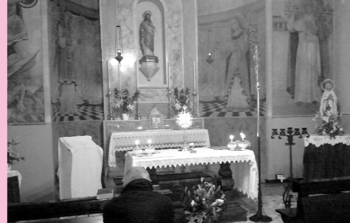
La cappella dell'Adorazione a Lagano

Ricordo un particolare che mi colpì abbastanza, vale a dire la perplessità di qualcuno al pensiero di fare festa il giorno dell'apertura, con tanto di processione eucaristica solenne, quando la sera prima era