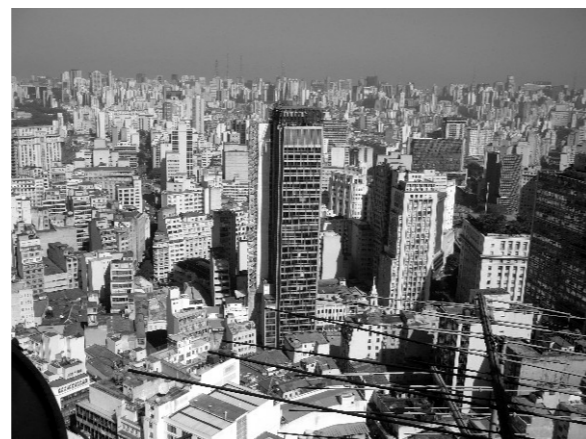
Vista del centro di San Paolo