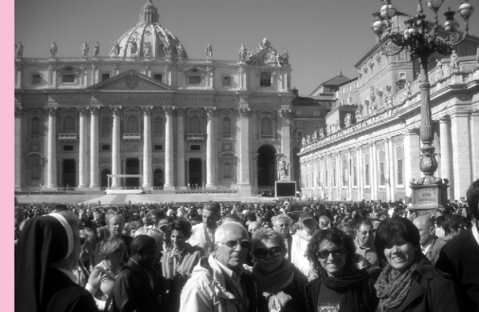
Foto a Piazza S. Pietro durante il Convegno a Roma