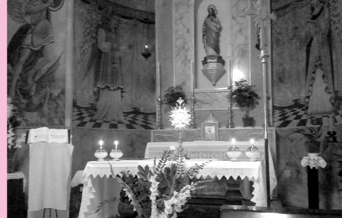
La cappella dell'Adorazione a Lagaro

Partii per Roma, diretto alla basilica di S. Anastasia, nei pressi del circo Massimo, e lì conobbi per la prima volta il rettore don