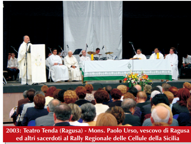
2003: Teatro Tenda (Ragusa) - Mons. Paolo Urso, vescovo di Ragusa ed altri sacerdoti al Rally Regionale delle Cellule della Sicilia