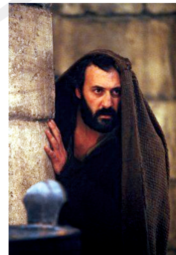
Una scena tratta dal film «The Passion»

Pietro: i peccati e la santità. La sua psicologia e il suo carattere sono davanti ai nostri occhi in totale trasparenza. Questa trasparenza è Vangelo, fa parte della Buona Novella della redenzione in Cristo, ragione per cui possiamo e dobbiamo metterci alla sequela di Pietro, del suo cammino con Gesù: per seguire il Signore come Lui vuole essere seguito, per aderire a Cristo come Lui vuole.