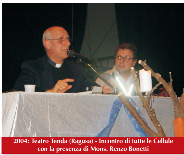
2004: Teatro Tenda (Ragusa) - Incontro di tutte le Cellule con la presenza di Mons. Renzo Bonetti