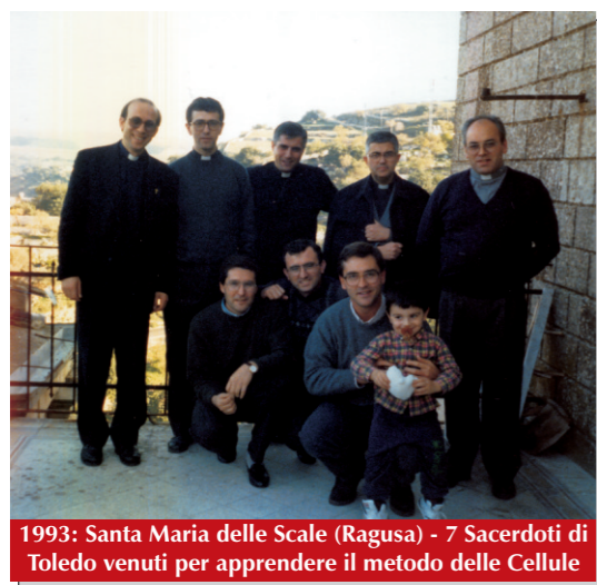
1993: Santa Maria delle Scale (Ragusa) - 7 Sacerdoti di Toledo venuti per apprendere il metodo delle Cellule