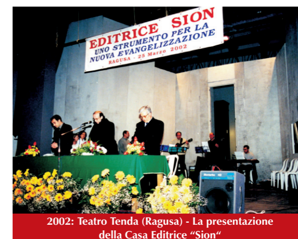
2002: Teatro Tenda (Ragusa) - La presentazione della Casa Editrice "Sion"