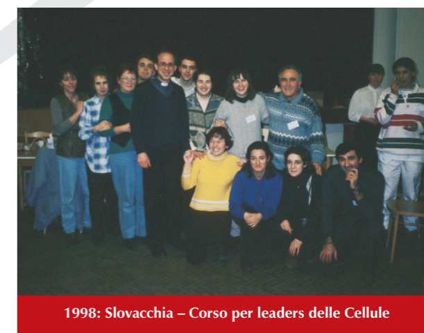
1998: Slovacchia - Corso per leaders delle Cellule