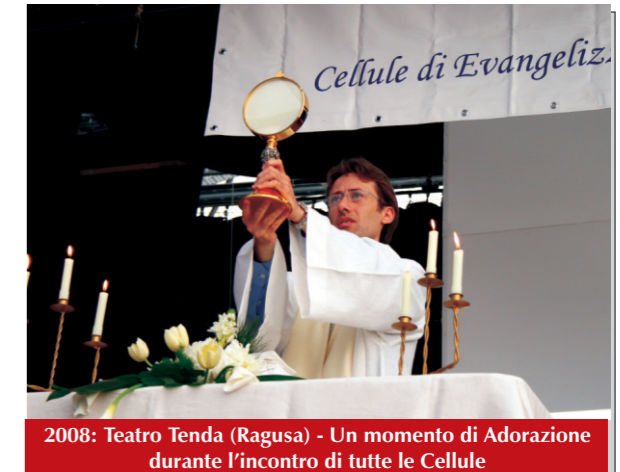
2008: Teatro Tenda (Ragusa) - Un momento di Adorazione durante l'incontro di tutte le Cellule