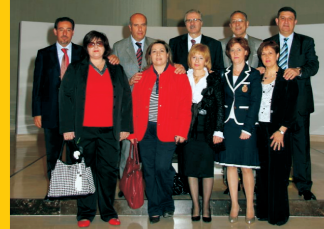
Alcuni membri della prima Cellula del 1989