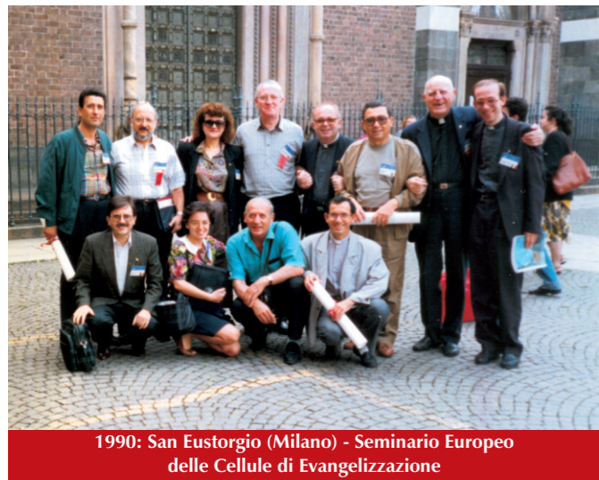
1990: San Eustorgio (Milano) - Seminario Europeo delle Cellule di Evangelizzazione