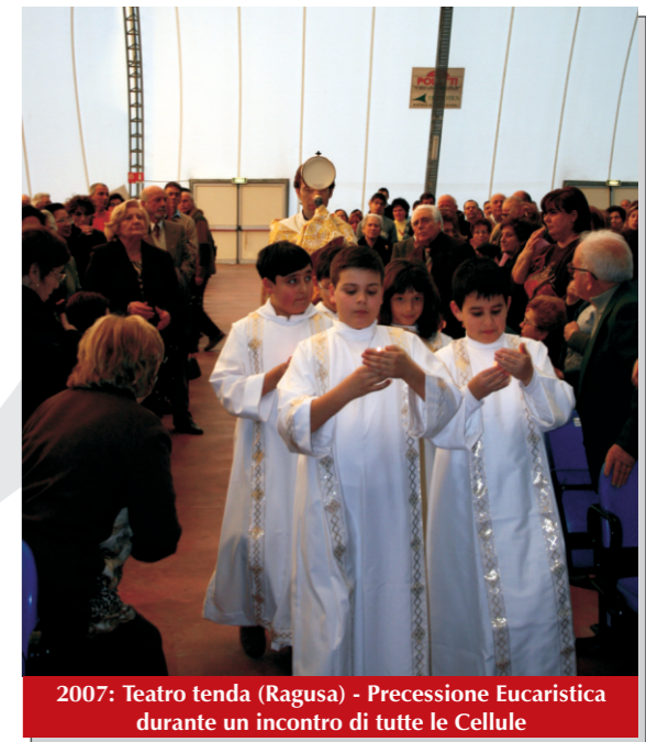
2007: Teatro tenda (Ragusa) - Precessione Eucaristica durante un incontro di tutte le Cellule