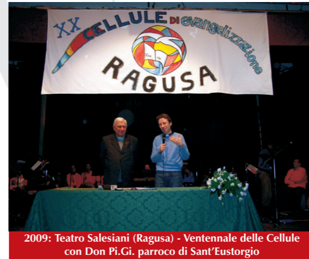
2009: Teatro Salesiani (Ragusa) - Ventennale delle Cellule con Don Pi.Gi. parroco di Sant'Eustorgio