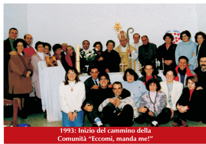
1993: Inizio del cammino della Comunità "Eccomi, manda me!"