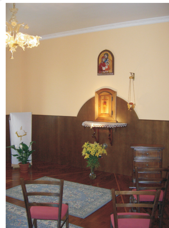
La cappella dell'adorazione in comunità

terre è già conosciuto Cristo e lo si adora" – mi hanno spiegato. E forse in effetti ogni casa, in qualsiasi luogo, se solo vi si vive la quotidianità familiare e lavorativa in ascolto della Parola di Dio, diventa un luogo ricco di doni come quelli che io ritrovo in Comunità. Anzi forse, riflettendoci, è questo il senso dell'episodio di Gesù a casa dei suoi amici: ogni casa, se lì si fa festa a Dio, Lo si ama, Lo si ascolta, se lì è pienamente e totalmente accolto Dio, diventa luogo di ristoro, di pace, di forza. Diventa fonte di vitalità del corpo e dell'animo. Diventa una comunità.