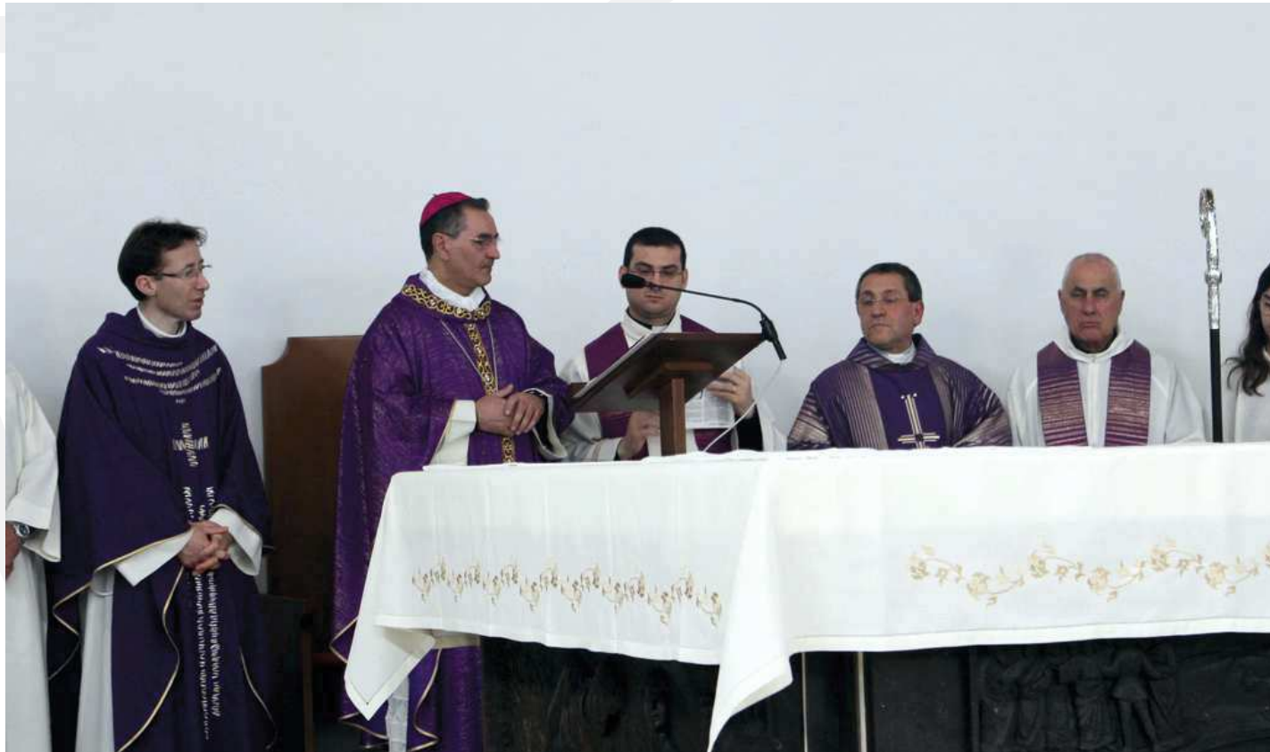
La Celebrazione Eucaristica presieduta dal Vescovo Mons. Carmelo Cuttitta