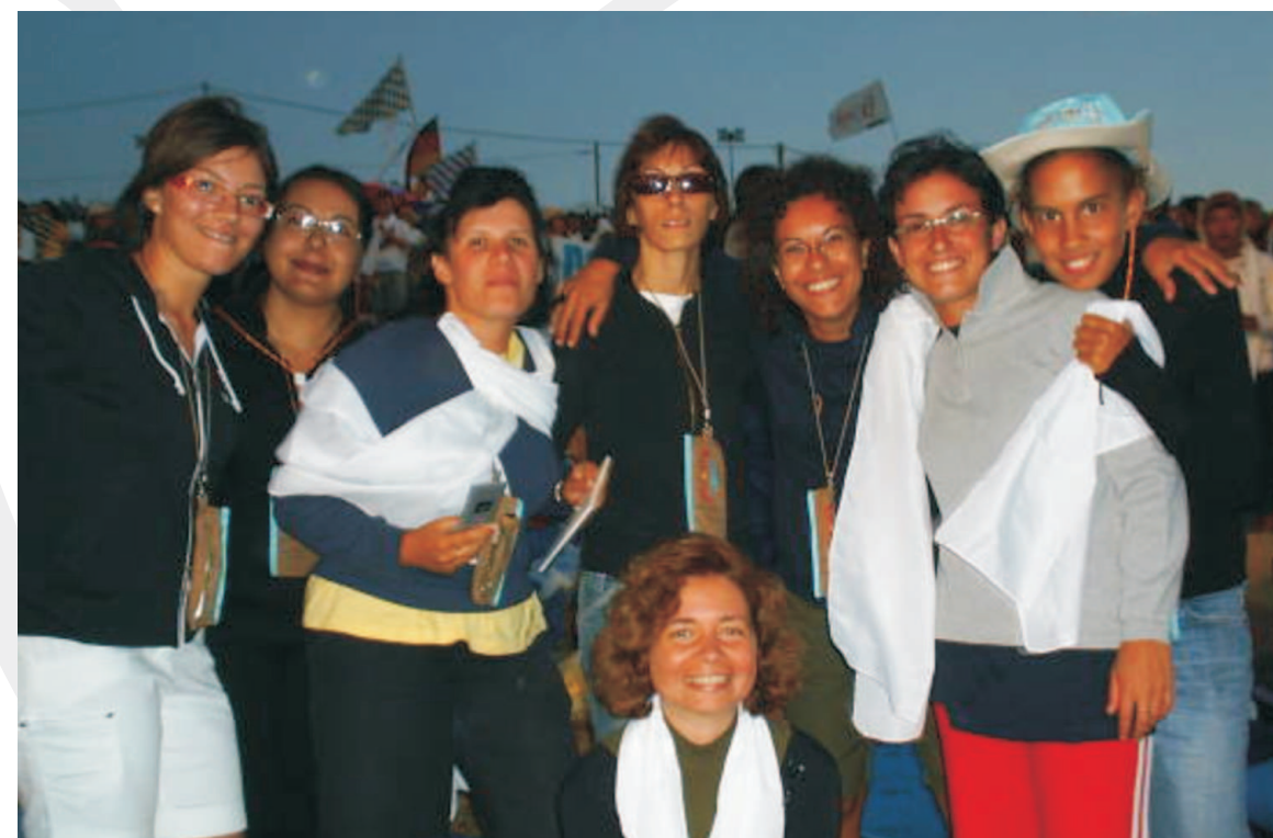
I ragazzi impegnati nell'evangelizzazione di Ferragosto

intrattenuti così con molti ragazzi a parlare fino a notte fonda di Gesù e della Sua Chiesa: l'esperienza ci ha testimoniato come il cuore dei giovani - e non solo - abbia bisogno del vero amore che è in Dio solo. Gesù dice “ Chi ha sete venga a me e beva ” (Gv 7, 37) e ancora una volta abbiamo visto che quanti hanno aperto il loro cuore a Cristo sono stati dissetati da Parole di vita eterna.