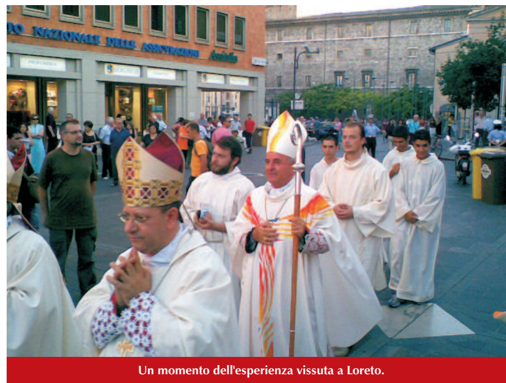
Un momento dell'esperienza vissuta a Loreto.

Questo ci spinge ancora di più ad alzare la nostra voce, perché tutti sappiano che qualcosa di grande è accaduto: Cristo è passato attraverso questo evento parlando al cuore di tanti e in essi niente può rimanere più come prima.