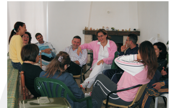
Alcuni momenti di vita comunitaria nella casa San Giuseppe